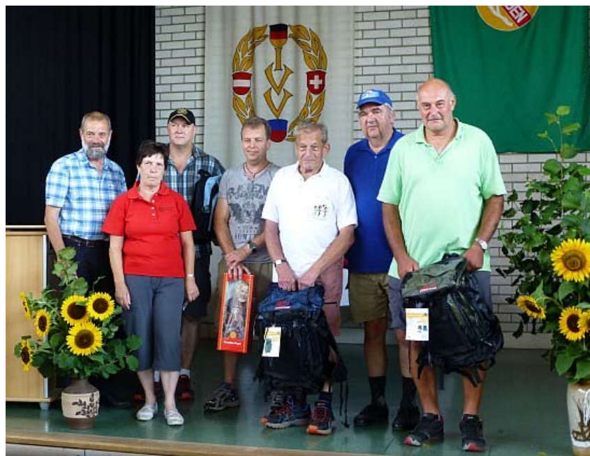
Siegerehrung beim Wanderverein Rotfelden 2015

Bericht: Schwarzwälder Bote/Uwe Priestersbach vom 21. Juli 2015 » zum Bericht