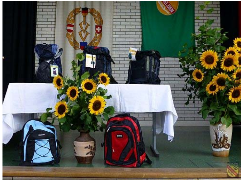
Preise für die Siegerehrung 2015

Jedem Wanderverein, der unseren Wandertag mit dem Bus besucht, garantieren wir einen Gegenbesuch!