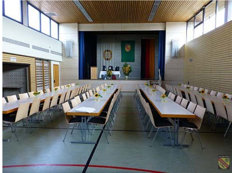
Gemeindehalle Rotfelden 2015